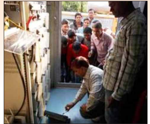
Assessment conducted for Telecom Equipment Operation Maintenance training 通信機器運用保守訓練のための評価