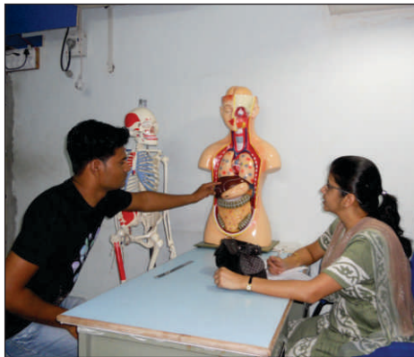
Assessment conducted for Medical and Nursing Training 医療と看護訓練の評価