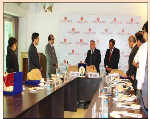
JITCO Team visited ASSOCHAM Corporate Office, New Delhi JITCOチームがASSOCHAMコーポレートオフィス、ニューデリーを訪問