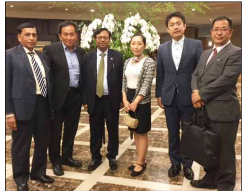
ASSOCHAM interaction with various stakeholder in Japan ASSOCHAMと日本の様々なステークホルダーとの交流