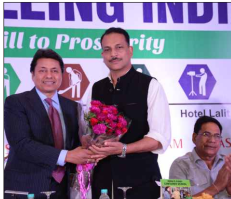
Glimpses of ASSOCHAM's Skilling India Summit ASSOCHAMのSkilling India Summitの一見