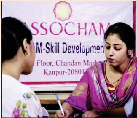
Assessment conducted for Apparel Training Center アパレルトレーニングセンターの評価

ASSOCHAMはこれまで、青少年1,00,000人以上の審査と認証を行ってきました